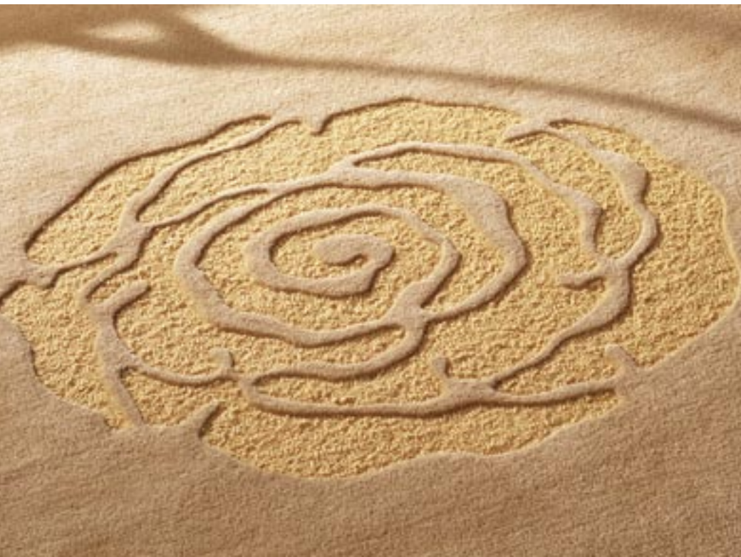
The natural impulse