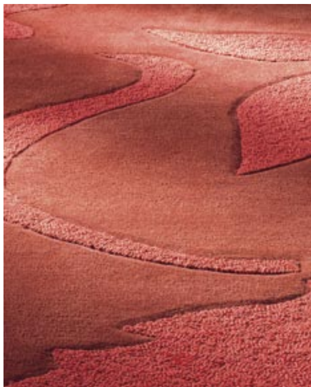
The instinctive decision